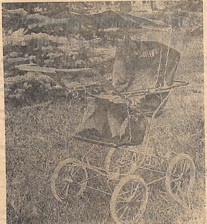
Коляска универсальная КУ 04-85