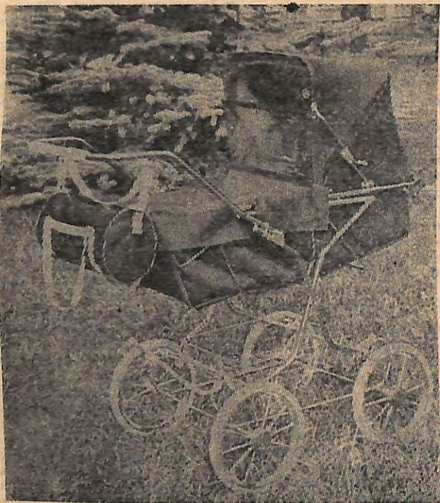
Коляска универсальная КУ 04-85