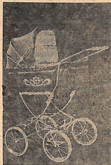
КЗ 84-86 «Ивушка»