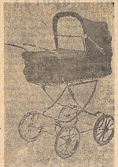
КЗ 85-86 «Яна»